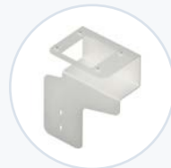
扫描器托架支架, CODE 2600 WF-SCNBRKT- CD2600