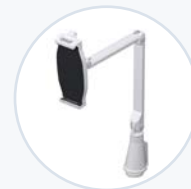
平板电脑平面支架 AM-TABMNT-S