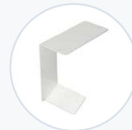
Zebra QLN220 打印机支架 WF-PBRKT-ZQLN2