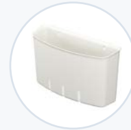
后置耗材篮, 聚合物 WF-RSUPBASK-P