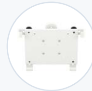
倾斜/旋转式平 板电脑支架 WF-TAB-MNT