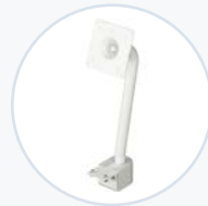
轻型 VESA 支架 WF-VESA-MNT-LT